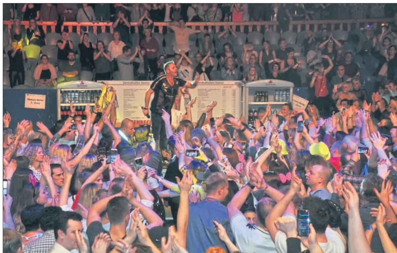
Volles Haus und Stimmung wie am Ballermann: Willi Herren begeisterte wieder einmal die Massen.